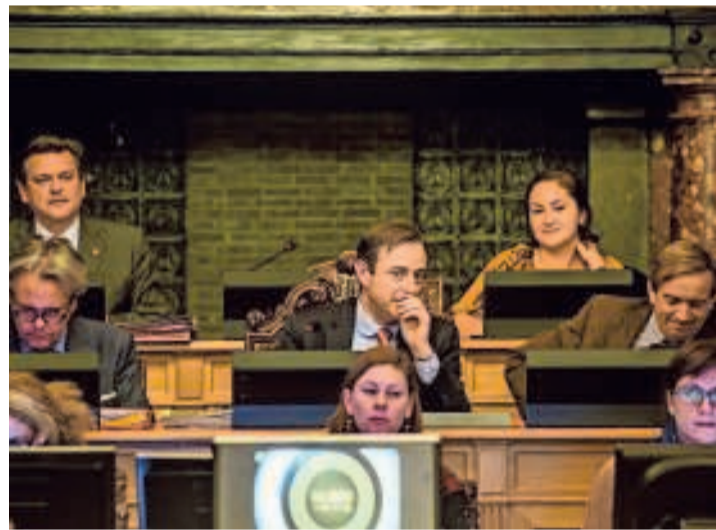
● Burgemeester Bart De Wever leidde dinsdag nog de Antwerpse gemeenteraad.

Een opmerking van haar partijgenoot Filip Dewinter was echter de druppel. "Ik laat in het midden of De Wever strategisch ziek is of een zieke strateeg, maar het zal wel het laatste zijn", opperde hij. Waarop de N-VA-fractie de zaal verliet. (KVDP/AVB)