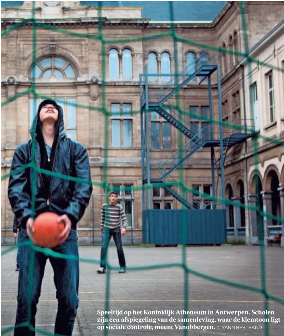
Speeltijd op het Koninklijk Atheneum in Antwerpen. Scholen zijn een afspiegeling van de samenleving, waar de klemtoon ligt op sociale controle, meent Vanobbergen.

zijn geboren lopen 76 procent meer kans om in het buitengewoon onderwijs te belanden. Dat toont aan dat ze weinig kansen krijgen om iets te betekenen en zichzelf te ontwikkelen."